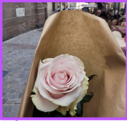
La fleur, une rose rose Elle est magnifique n'est-ce pas?

Le 27 avril 2023 on était à Strasbourg avec notre classe de Français. Nous avons fait un promenade en bateau. Ensuite, nous avons mangées au restaurant à midi, après nous avons fait de shopping et acheter des macarons et des Pâtisseries pour nos familles. Enfin, nous avons eu pris de photos avec un café et une fleur. Le jour était magnifique et inoubliable.